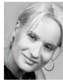
Γράφει η Σοφία Τσιπτε

Δικηγόρος παρ' Αρείω Πάγω Διαπιστ. Διαμεσολα- βήτρια ΥΔΑΔΔ (αστική, εμπορική, ηλεκτρονική, τραπε- ζική Διαμεσολάβηση) Υπεύθυνη Προστασίας Δεδομένων / D.P.O. εκεσ.