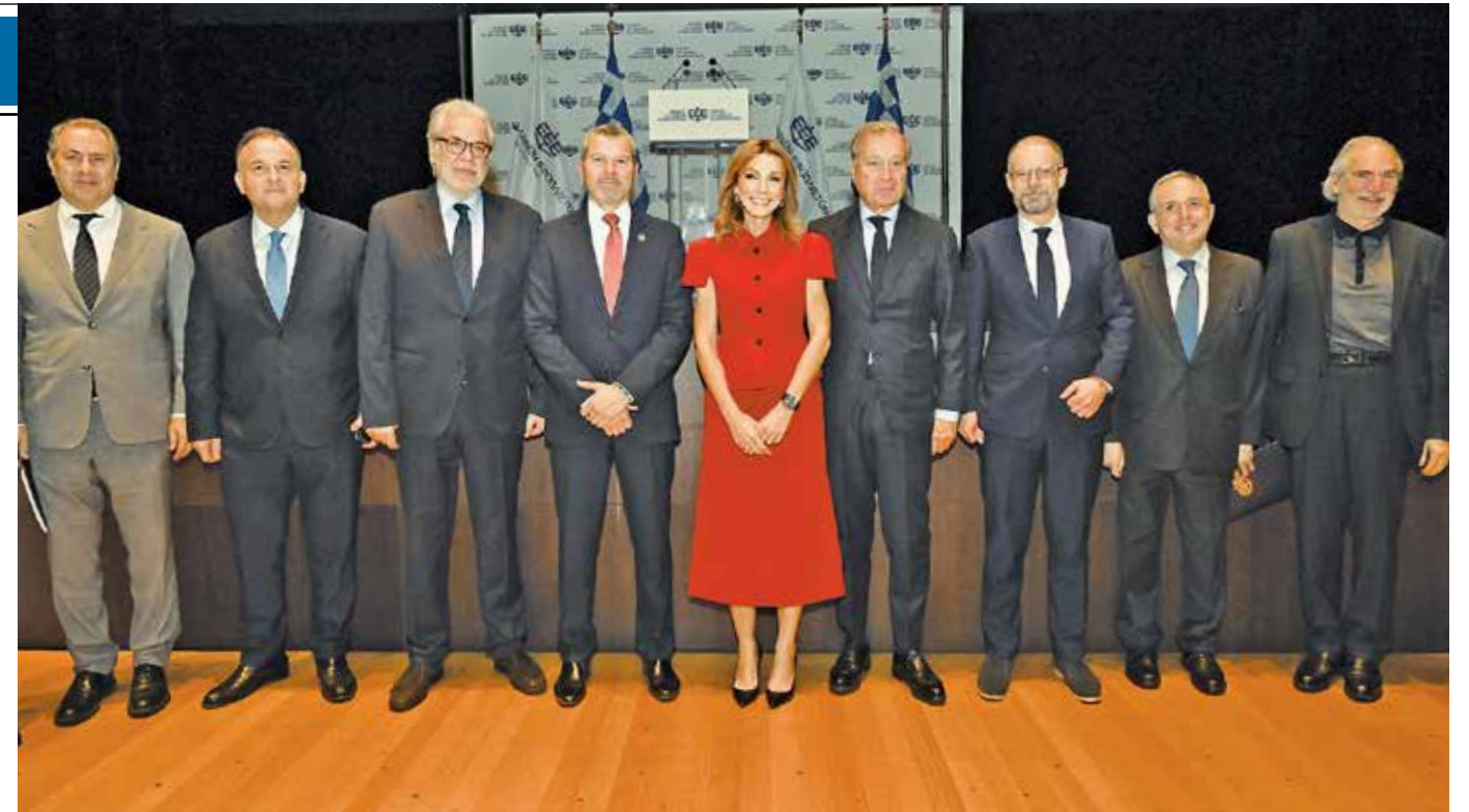
Η σφραγίδα της πολυδιάστατης συνεισφοράς μας στην πατρίδα είναι πιο ανεξίτηλη από ποτέ, δήλωσε η πρόεδρος Μελίνα Τραυλού μιλώντας στη γ.σ. της Ένωσης Ελλήνων Εφοπλιστών

Ιδιαίτερη ήταν η αναφορά της στο επίκαιρο θέμα της εφαρμογής του ευρωπαϊκού συστήματος εμπορίας ρύπων (EU ETS). Όπως τόνισε, στόχος μας είναι να μειώσουμε τις αρνητικές συνέπειες στον κλάδο μας, αλλά η ελληνική πλευρά επιμένει στην ουσία ότι «η εφαρμογή του EU ETS στη ναυτιλία παραμένει ένα περιφερειακό μέτρο με εισπρακτικούς στόχους. Είμαστε, λοιπόν, σταθεροί στη θέση μας για την ανάγκη λήψης μέτρων από τον δι-